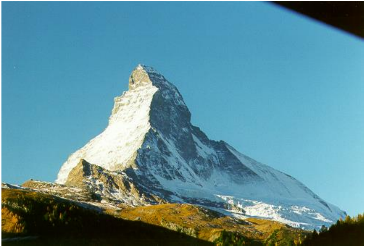
Sicht vom Balkon / Vue du balcon /balcony view